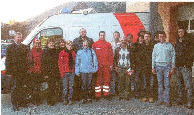
Große Teilnahme der Mitarbeiter am Erste Hilfe-Kurs.

leistet mit seinem Team perfekte Arbeit – in einigen Wochen wird das erlernte und trainierte Wissen zur Festigung noch einmal wiederholt.